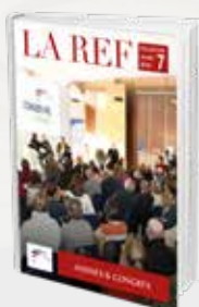
Assises & Congrès