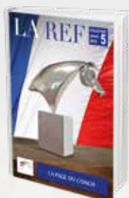
La page du coach