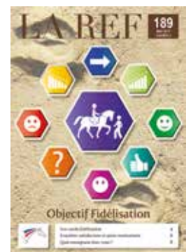
Le Dossier Objectif Fidélisation de La Ref 189 Cahier 2 réunit tous les éléments pour mettre en oeuvre votre plan de fidélisation.

L'hiver est long. Je profite des vacances de Noël pour organiser un moment de convivialité et fédérer mon équipe autour d'un projet commun.