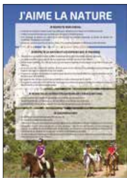
L'affiche J'aime la nature est téléchargeable sur ffe.com/tourisme/Gites-et-Chemins/Ressources-documentaires .

7 e chapitre du Guide fédéral Galop® 4 , le Permis Cheval® est le guide des bonnes pratiques pour circuler à cheval dans des environnements variés et notamment sur la voie publique. Vous pouvez vous servir de ces 15 pages comme support théorique, rappelant les conseils de bon sens pour circuler sur la route, les chemins, dans les forêts... Appropriez-le vous comme outil pour évaluer la capacité d'autonomie de vos cavaliers et pour leur faciliter l'acquisition des bases d'une pratique de l'équitation d'extérieur en toute sécurité.