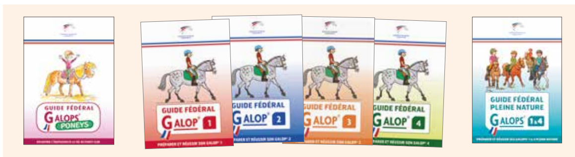
Les Guides sont disponibles dans la boutique en ligne FFE. Tarif préférentiel pour les clubs à partir de 10 exemplaires.

ILS DONNENT DE LA LISIBILITÉ À LA DÉMARCHE PÉDAGOGIQUE DE L'ENSEIGNANT. ILS PERMETTENT AU CLUB DE FIDÉLISER D'AVANTAGE.