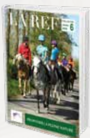
Proposer la pleine nature