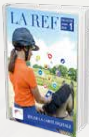
Jouer la carte digitale