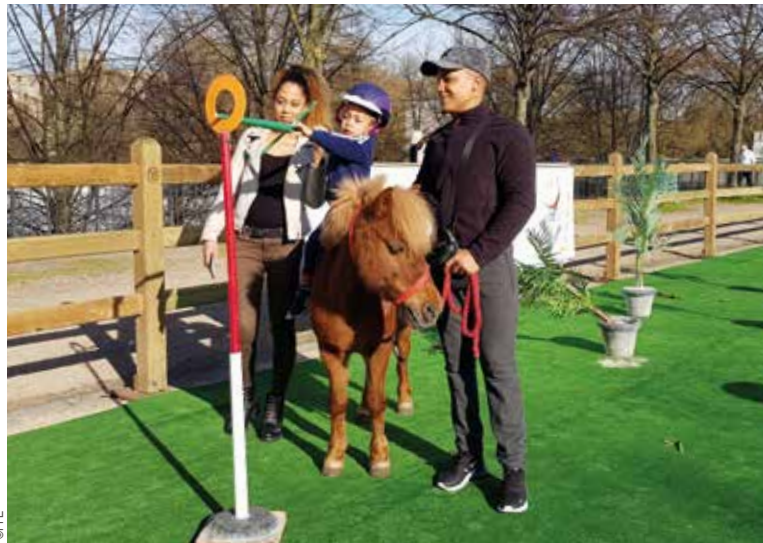
Un poney-club éphémère permet d'aller à la rencontre du public

Je pense à actualiser pour la rentrée mes documents de communication, site internet, affichage extérieur, dépliants, message téléphonique etc.