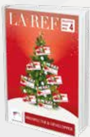
Prospecter & Développer