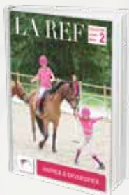
Animer & Diversifier