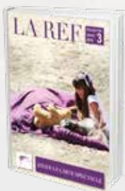
Jouer la carte spectacle