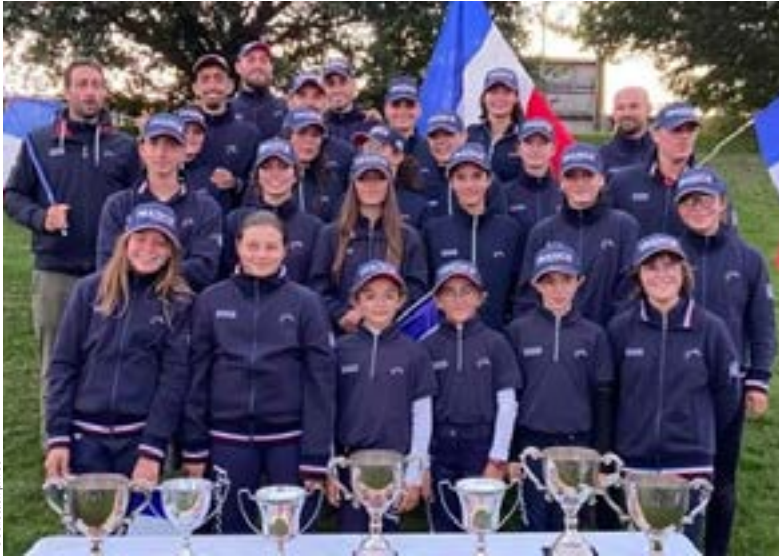
L'équipe de France pony-games à Rugby