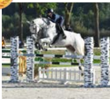
Gabrielle Campoli / Chase (Hunter)