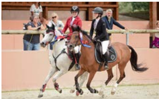
Sourires inoubliables au tour d'honneur

PAS MOINS DE 600 COUPLES SE SONT EMPARÉS DU PARC ÉQUESTRE FÉDÉRAL DU 24 AU 26 AOÛT POUR LES PREMIERS RENDEZ-VOUS DE SOLOGNE.