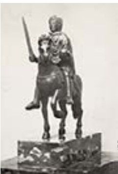
Au temps de Charlemagne (742-814), on disait un cheval / des chevaux

Les SMS nous rapprochent finalement des scribes médiévaux !