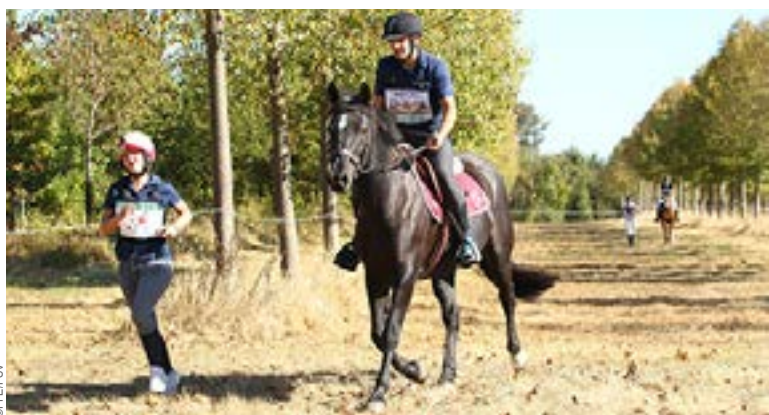
Ride & Run, Ride & Bike sont d'excellents supports de diversification qui permettent d'associer les familles.

LES VACANCES DE TOUSSAINT SIGNENT LA FIN DE LA PÉRIODE DE RENTRÉE. C'EST LE MOMENT DE COMMENCER LA CAMPAGNE DE FIDÉLISATION POUR QUE LES NOUVEAUX CAVALIERS TRANSFORMENT LEUR DÉCOUVERTE EN PASSION DURABLE. ET AUSSI CELUI DE COMPLÉTER LE RECRUTEMENT.