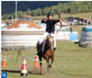
Photographies TAC@IFFE 15