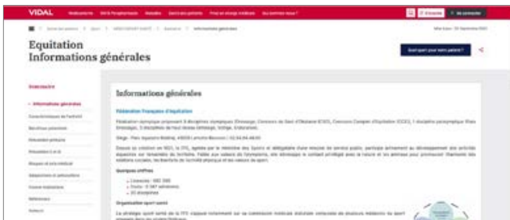
La page équitation sur Médicosport

LA FFE CONSTRUIT ET MET PROGRESSIVEMENT EN ŒUVRE SA STRATÉGIE FÉDÉRALE SPORT SANTÉ BIEN-ÊTRE EN ADÉQUATION AVEC LA STRATÉGIE NATIONALE SPORT SANTÉ, CO-PILOTÉE, POUR L'ESSENTIEL, PAR LE MINISTÈRE DES SPORTS ET LE MINISTÈRE DES SOLIDARITÉS ET DE LA SANTÉ.