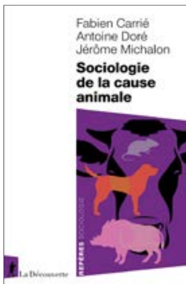
Editions La Découverte. 128 pages. 12 x 19cm. 11€

Ils ont déjà commencé par la contestation frontale de la vénerie et, grave