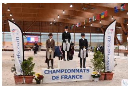
Le podium du Championnat de France des chevaux de 7 ans.