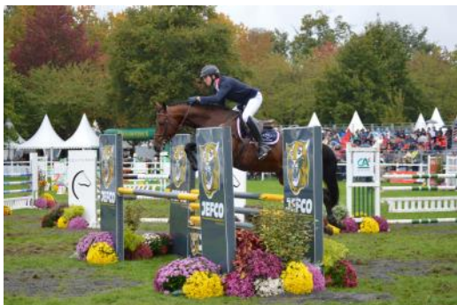
Cestuy la de l'Esques et Thomas Carlile.