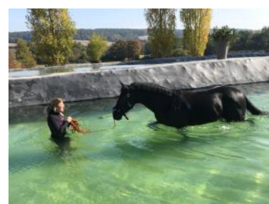
Comme tout athlète de haut niveau, le cheval bénéficie de soins poussés. ©Temple thermal équin by Needwell - Catherine Lawson

De nombreux critères entrent donc en compte pour permettre au cheval de progresser mais outre le travail, la bienveillance et l'amour du cavalier pour sa monture restent la pierre angulaire à sa performance.