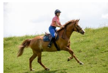
Travailler son cheval en extérieur sur des montées et des descentes est bon pour sa musculature.

Comme chez l'homme, le cheval peut se lasser si les exercices sont trop répétitifs. Il est donc conseillé de varier le travail mais aussi les endroits où l'on effectue sa séance. Alterner entre manège et extérieur lui permet de « s'aérer » la tête. Il est également recommandé de le faire évoluer sur des terrains variés favorisant plusieurs aspects de sa musculature et ainsi améliorer selon les besoins, son explosivité ou son endurance.