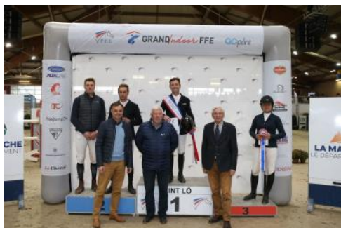
Le podium de la 2 e étape du Grand Indoor FFE-AC Print.