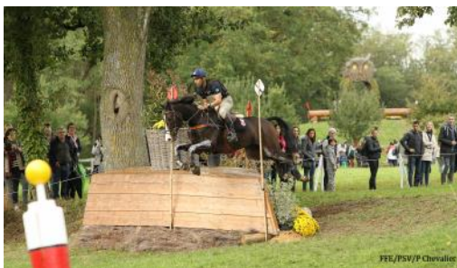
Lumberton et Astier Nicolas.