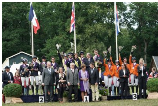
Le podium.