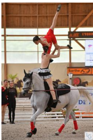
Meaux et Plouf.