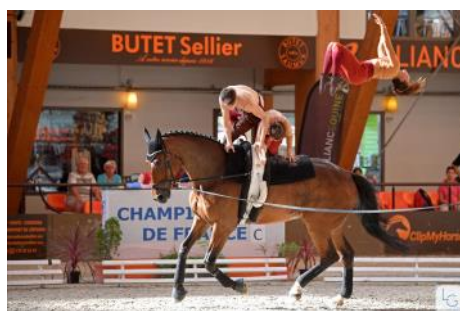
La Team Noroc et Sushi de la Roque.