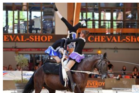
Meaux et Azur d'Avril.