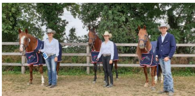
Les Jeunes cavaliers remportent l'argent.