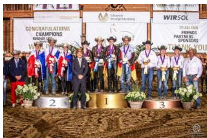
Le podium du championnat du monde Jeunes cavaliers.

Le CS Ranch a accueilli les championnats d'Europe Seniors de western et championnats du monde Juniors et Jeunes cavaliers du 9 au 13 juillet 2019 à Givrins en Suisse. Les Jeunes cavaliers tricolores ont tiré leur épingle du jeu en décrochant l'argent par équipe.