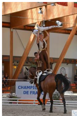
Les Écuries du Petit Dan.