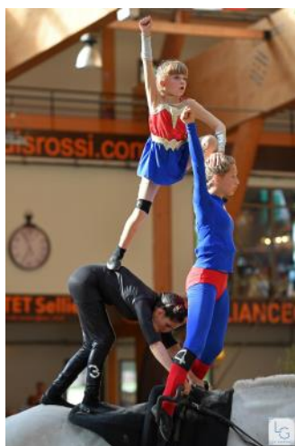
Les Supers Héros.