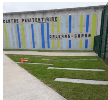
Le centre pénitentiaire d'Orléans-Saran qui a accueilli la formation « Sport en milieu carcéral ».

La FFE souhaiterait identifier des enseignants susceptibles d'être intéressés pour ensuite élaborer un projet au sein de leurs structures.